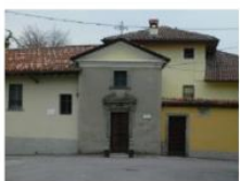
Oratorio di S. Gerolamo

https://www.lombardiabeniculturali.it/architetture/schede/LC120-00170/