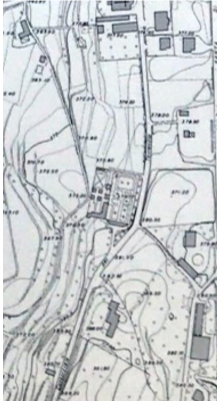
Aereofotogrammetrico del 1971 del cimitero di Monticello Capoluogo, è evidente l'utilizzo dell'ampliamento verso ovest e la presenza dei primi colombari