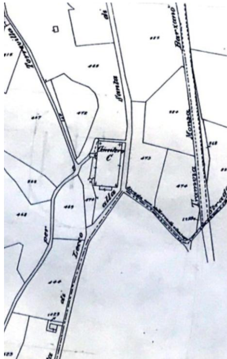
Catasto storico del 1949, il cimitero di Monticello Capoluogo è individuato con la lettera "C" e con la scritta "Cimitero"