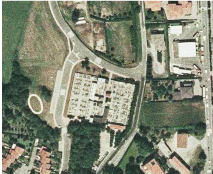
Ortofoto del 2003 del cimitero di Monticello Capoluogo, è evidente l'utilizzo del secondo ampliamento verso ovest con anche la presenza dei nuovi colombari