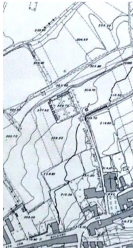
Aereofotogrammetrico del 1971 del cimitero di Cortenuova, è evidente il primo nuovo blocchi di colombari verso nord