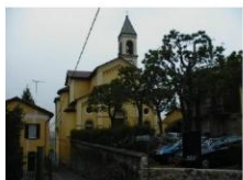
Chiesa del SS. Redentore- complesso

https://www.lombardiabeniculturali.it/architetture/schede/LC120-00171/