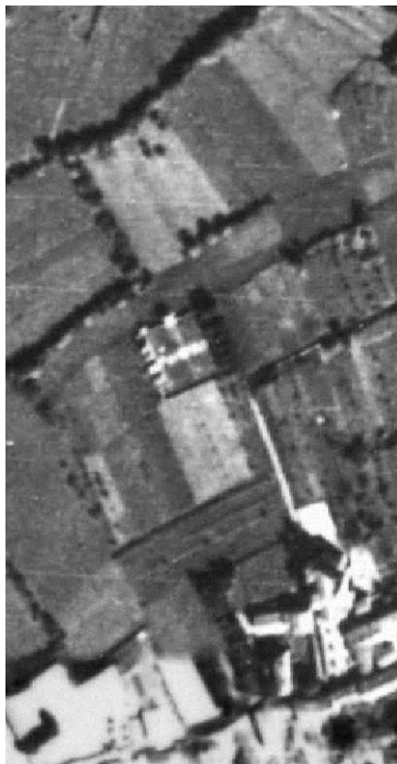
Ortofoto del 1954, il cimitero di Cortenuova è sostanzialmente invariato rispetto alla soglia precedente