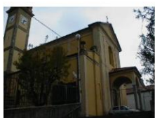
Chiesa di S. Maria della Purificazione - complesso

https://www.lombardiabeniculturali.it/architetture/schede/LC120-00178/