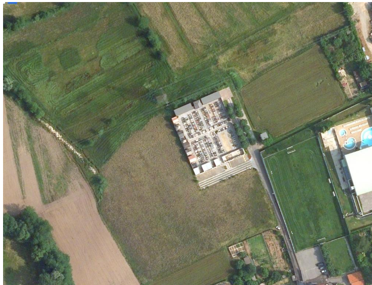
Ortofoto del 2015 del cimitero di Cortenuova, appaiono i nuovi colombari verso sud

Stato Attuale Vedi Documentazione fotografica