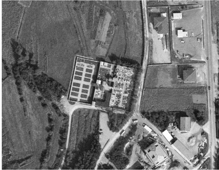
Ortofoto del 1975 del cimitero di Monticello Capoluogo, è evidente il secondo l'ampliamento verso ovest