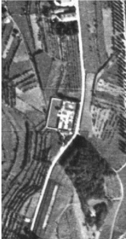
Ortofoto del 1954, il cimitero di Monticello Capoluogo è evidente il primo l'ampliamento verso ovest con la presenza dell'area recintata