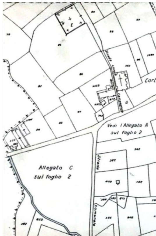
Catasto storico del 1949, il cimitero di Cortenuova è individuato con la lettera "E" Il toponimo della strada era "Strada consortile della Campagnola" non ancora "via Rimembranze"