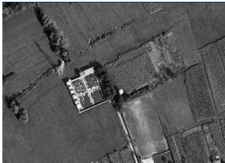
Ortofoto del 1975 del cimitero di Cortenuova, il cimitero è sostanzialmente invariato rispetto alla soglia precedente