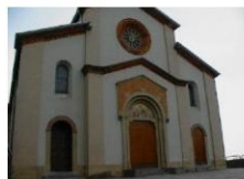
Chiesa di S. Agata - complesso

Dall'analisi storica deduciamo che, come in uso nel periodo e fino al 1804 il cimitero era con ogni probabilità davanti e/o adiacente alle quattro chiese, non era invece presente presso la chiesa del Santissimo Redentore in quanto sorta in epoca più recente.