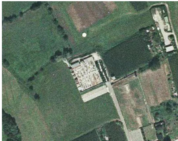
Ortofoto del 2003 del cimitero di Cortenuova, è evidente la seconda stecca dei colombari e la nuova area a parcheggio a sud