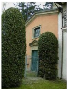
Oratorio di S. Maria Assunta

https://www.lombardiabeniculturali.it/architetture/schede/LC120-00177/