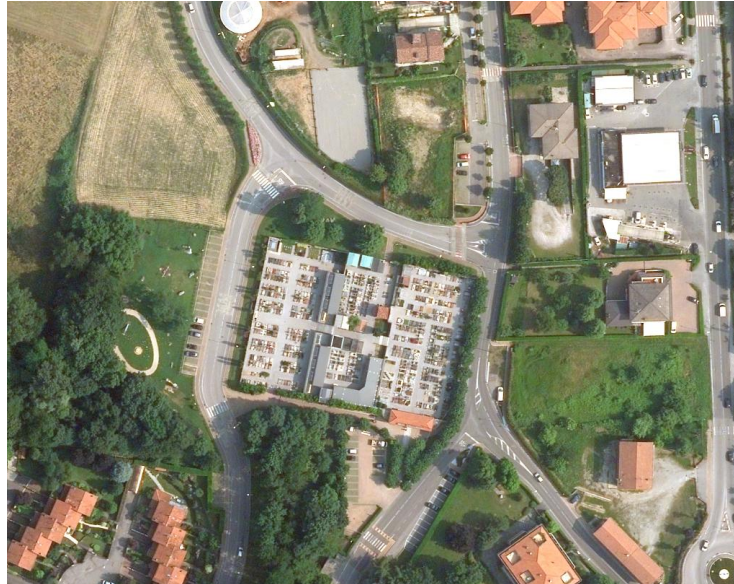
Ortofoto del 2015 del cimitero di Monticello Capoluogo, il cimitero è sostanzialmente invariato rispetto alla soglia precedente